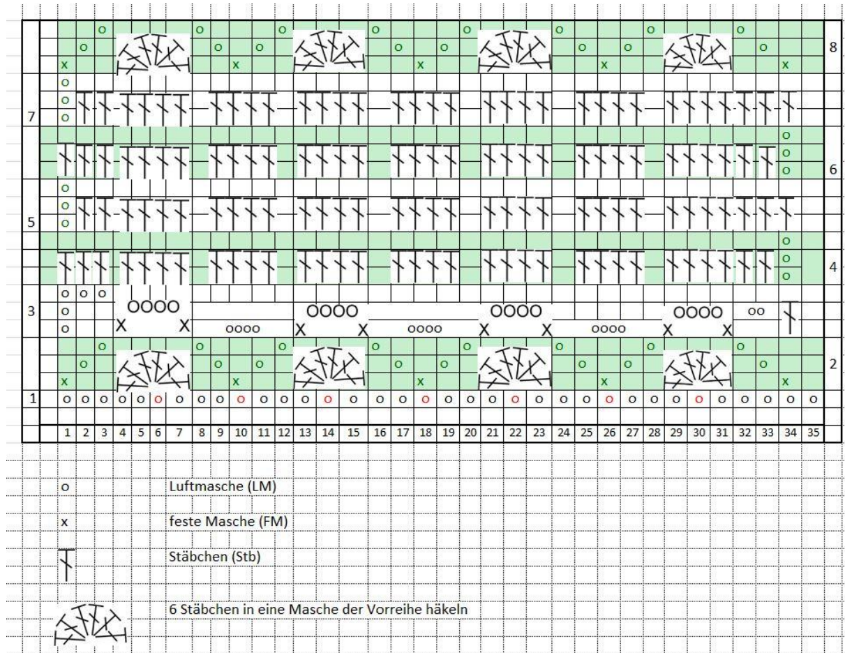
Chart 1 - Mittelteil